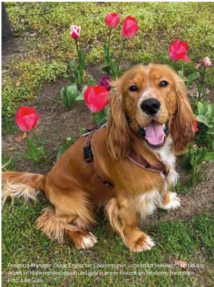
Feelgood-Manager: Oskar, Englischer Cocker spaniel, unterstützt sein Herrchen bei der Arbeit im Malermeisterbetrieb und geht in seiner Freizeit am liebsten schwimmen.