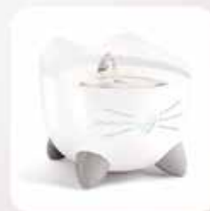
Catit PIXI Trinkbrunnen mit Edelstahlinsatz