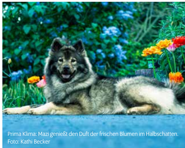
Prima Klima: Mazi genießt den Duft der frischen Blumen im Halbschatten.