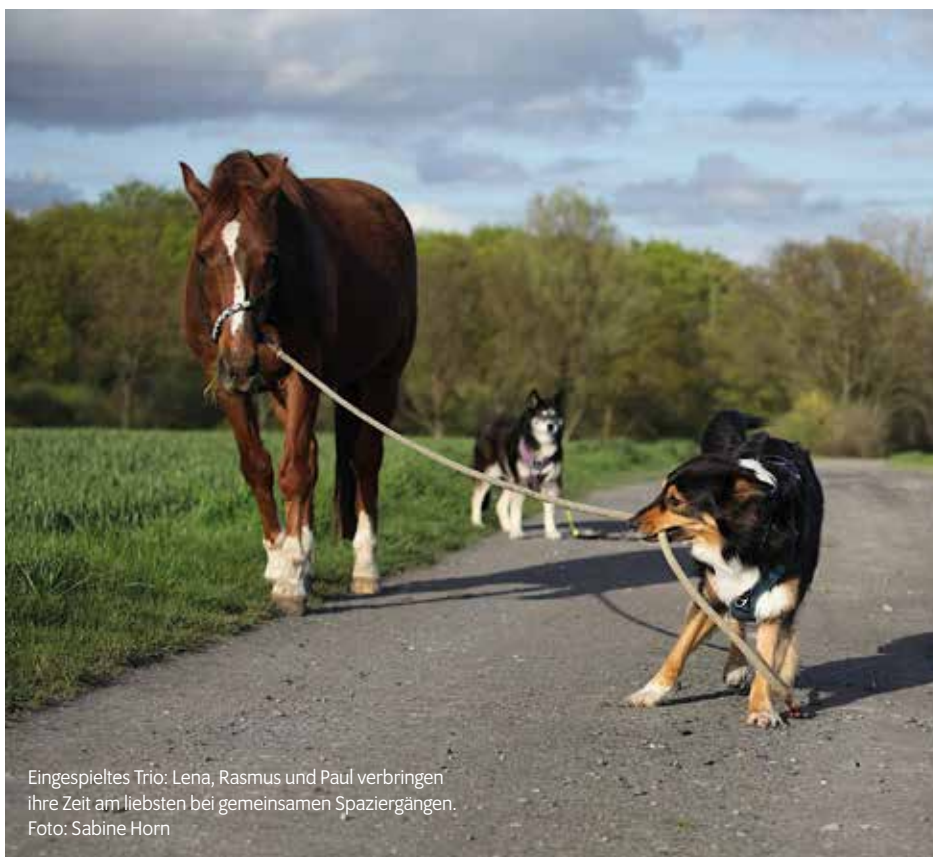
Eingespieltes Trio: Lena, Rasmus und Paul verbringen ihre Zeit am liebsten bei gemeinsamen Spaziergängen.