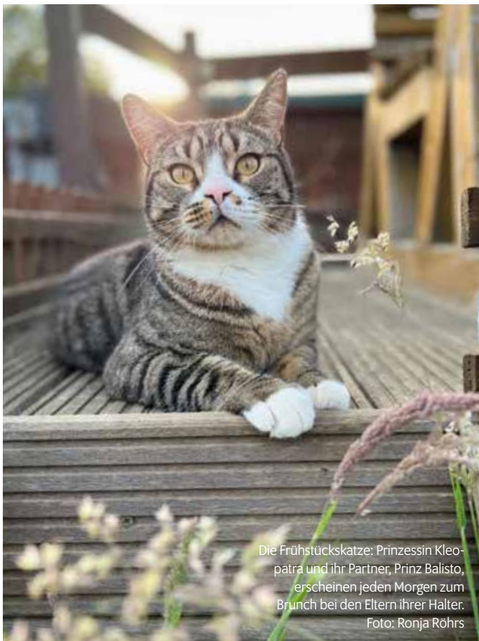
Die Frühstückskatze: Prinzessin Kleopatra und ihr Partner, Prinz Balisto, erscheinen jeden Morgen zum Brunch bei den Eltern ihrer Halter.