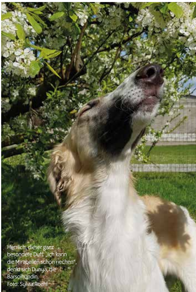
Herrlich, dieser ganz besondere Duft: „Ich kann die Mirabellen schon riechen“, denkt sich Dunya, die Barsoihündin.