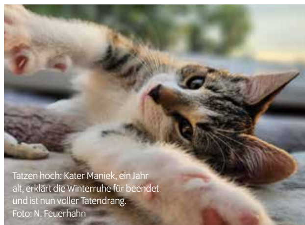
Tatzen hoch: Kater Maniek, ein Jahr alt, erklärt die Winterruhe für beendet und ist nun voller Tatendrang.