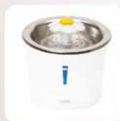
Catit Blumentrinkbrunnen mit Edelstahlinsatz

Es ist ein absolutes Muss, dass Ihre Katze viel Wasser trinkt! Dehydrierung kann zu ernsthaften Gesundheitsproblemen wie Nieren- und Harnwegserkrankungen führen. Zum Glück wirken Trinkbrunnen wahre Wunder, wenn es darum geht, Ihre Katze dazu zu bringen, mehr Wasser zu trinken.